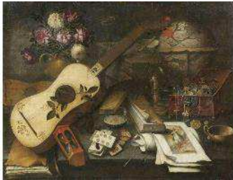
Attribué à Antonio de Pereda (1608/167)