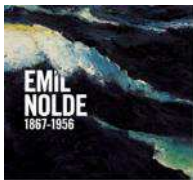
Emil Nolde (1867/1956)

Les pinceaux, la main du peintre, des couleurs vives qui s'étalent, la symphonie peut commencer. Une ferme rouge, un cheval noir qui galope dans un paysage aux couleurs de feu, tout nous rappelle les expressionnistes allemands Emil Nolde mais aussi Franz Marc qui a peint de nombreux chevaux.