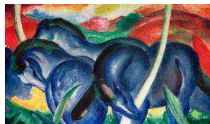
Franz Marc (1880/1916)